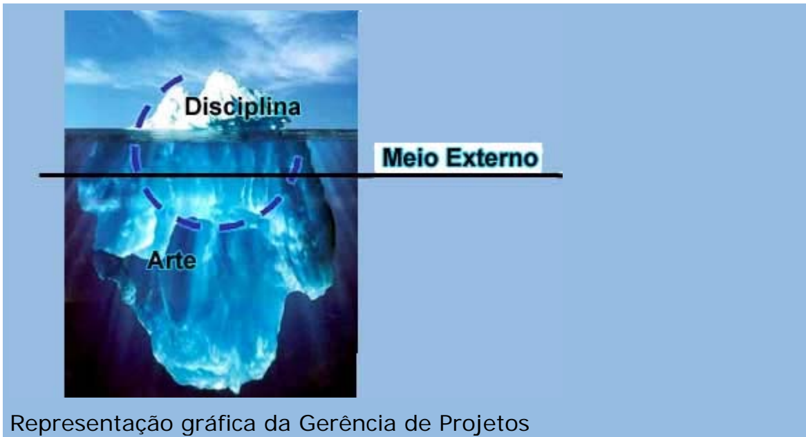
Representação gráfica da Gerência de Projetos

valorizar de maneira mais evidente algumas características ligadas ao direcionamento da equipe e gerência de stakeholders . Algumas das modificações feitas em suas áreas de conhecimento sugerem uma maior “humanização” da gerência de projetos e não somente competências técnicas do gerente enquanto planejador, controlador, executor e responsável geral pelo projeto. Este movimento, apesar de legítimo, acaba por provocar interessantes discussões sobre até que ponto as habilidades de gerenciamento, considerada por muitos autores como “a arte de gerenciar” pode ser ainda mais fundamental do que o próprio conhecimento técnico em si, aliado à utilização de uma forte metodologia de gerenciamento. Como exemplo desta visão, poderíamos representar a gerência de projetos através da analogia com um iceberg conforme a figura a seguir: